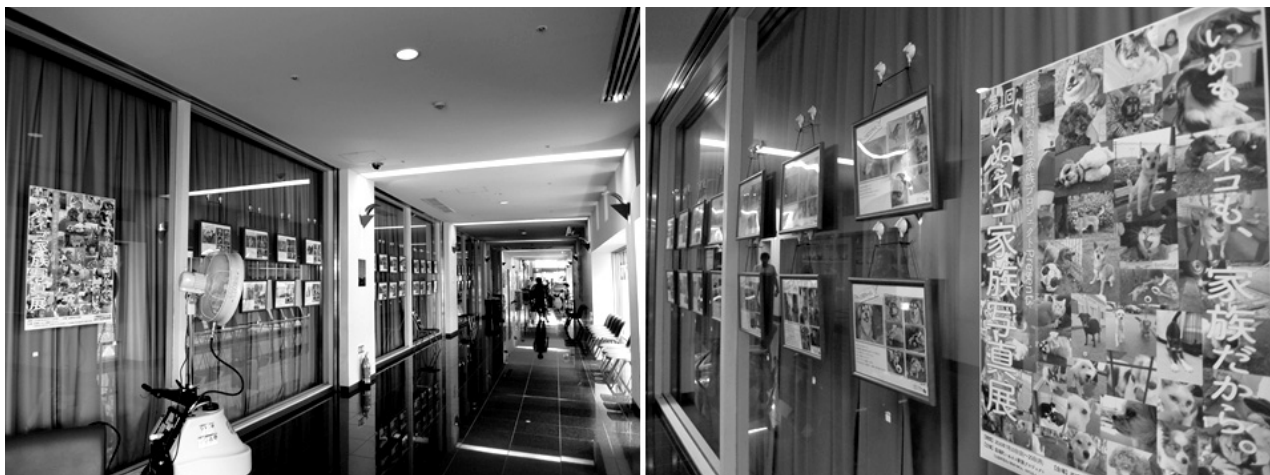
図6 「第1回いぬネコ家族写真展」会場の風景

ペットの写真を撮影し、飼い主に贈る活動を続けている。当初は、筆者のような外部からの支援者が、被災された方々と関わるためのきっかけ作りとして写真撮影を行っていたに過ぎず、筆者自身も、それに「支援」として何らかの意味があるかどうかは、十分に理解していなかった。写真自体も、避難所で生活するペットの何気ない姿を撮影したものであり、特にシンボリックな意図を込めるようなこともなかった。しかし、飼い主から「(この犬とは) 10年一緒に住んでいるけれど、自分とのツーショット写真は撮ったことがなかったので嬉しい」等の喜びの声が寄せられたので、以後、避難所で出会ったほとんど全てのペットの写真を撮影し、飼い主に届けてきた。