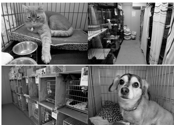
図3 猫舎（写真上）・犬舎（写真下）の内部

され、最大で犬35頭・猫15頭が飼育可能となっている。プレハブ内には、犬猫を収容するためのケージとともに、冷暖房が設置されている（図3）。ケージは1頭につき1個であり、どのケージにどの犬猫を入れるかは、スタッフがペット同士の相性等から判断して決定された。