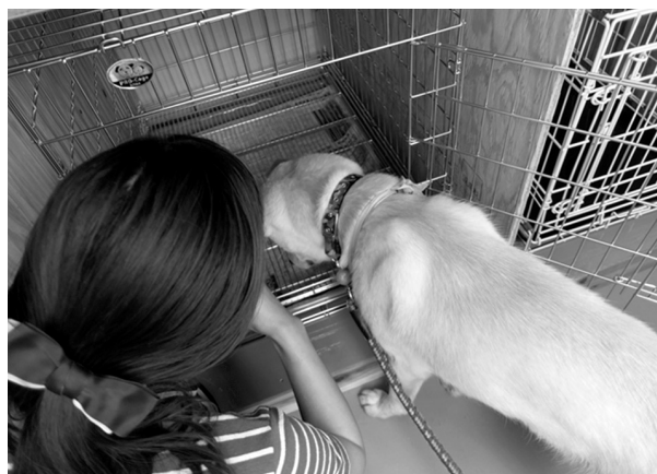
図4 犬のケージ・トレーニング（スタッフによる飼い方指導の一例）

トラクター等の専門性を有した専従スタッフによる、避難ペットの飼い方指導と飼育補助であった。飼い方指導の一例として、犬のケージ・トレーニングが挙げられる。ハウスでの犬猫は、体格に合わせて、1頭につき1個のケージ内で飼育されるが、特に犬について、これまでケージに入れたことがない飼い主がほとんどであり、そのような飼い方について不安を覚える人も少なくなかった。スタッフは、「ケージは犬の『閉じ込め部屋』ではなく、犬が安心して休める場所になるんですよ」と、飼い主に丁寧に説明するとともに、陽性強化法を用いて、犬をケージに慣らさせるトレーニングを重ねた（図4）。この結果、ほとんどの犬は、比較的短期間にケージでの生活に順応し、その姿を見た飼い主は、大いに安堵することとなった。