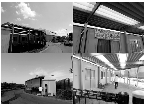
図2 「益城町わんにゃんハウス」外観（写真左）と屋根付ドッグラン（写真右）

され、最大で犬35頭・猫15頭が飼育可能となっている。プレハブ内には、犬猫を収容するためのケージとともに、冷暖房が設置されている（図3）。ケージは1頭につき1個であり、どのケージにどの犬猫を入れるかは、スタッフがペット同士の相性等から判断して決定された。