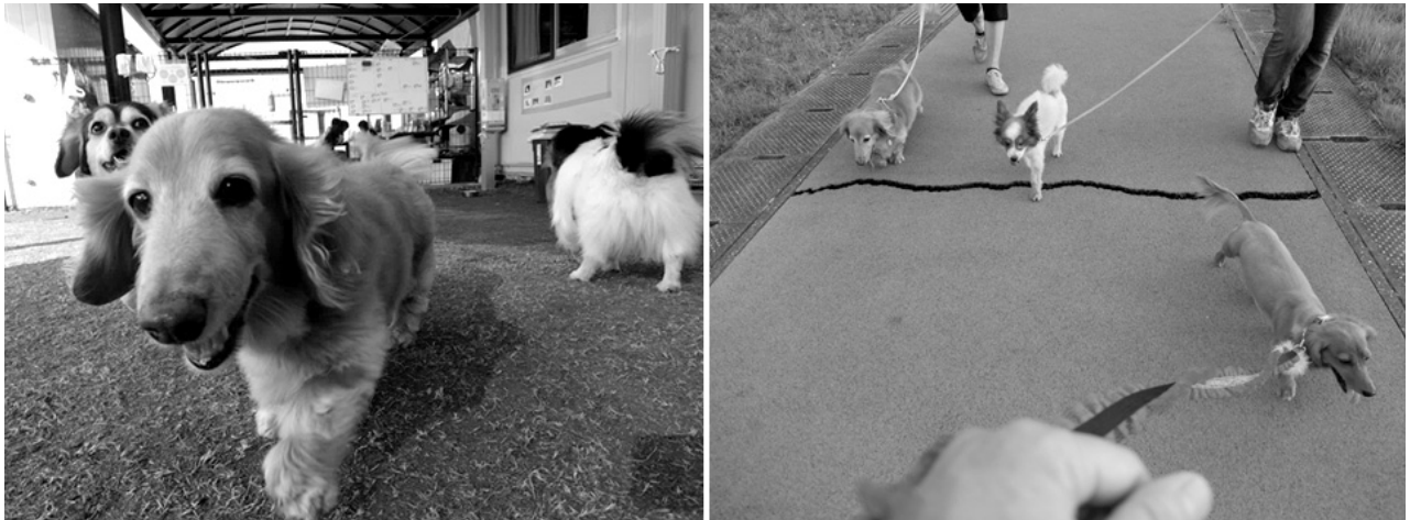
図5 ドッグラン・散歩による犬のストレスケア（スタッフによる飼育補助の一例）

降、同避難所内で、ペットに関する苦情が寄せられることはなくなったという。また、多数の犬猫が飼育されているにも関わらず、ハウス内はペットの臭いがしないなど、施設内の清潔な環境が保たれることとなった。